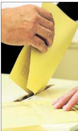
Am 30. August ist Kommunalwahl.

Der Vlothoer Anzeiger will die Kandidaten, die zur Kommunalwahl am Sonntag, 30. Au-