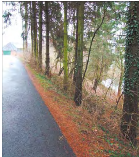
Rechts der Straße geht es steil abwärts zu den Quellen. Nach einigen Stürmen bietet der Wald am Hollenhagen keinen Schutz vor Abstürzen mehr, meinen Exteraner.

Nun soll zunächst eine Liste mit allen Laternen und deren Mängeln erstellt werden, die dann nach Priorität abgearbeitet wird.